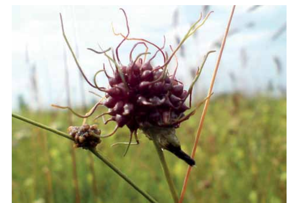
R5-9 | Kurtadombi-gyepen bunkós hagyma