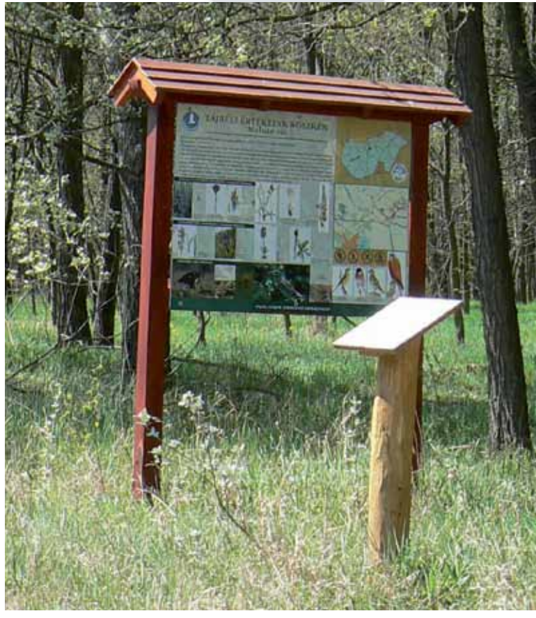
R5-4 | Molnár-rét tanösvény állomás