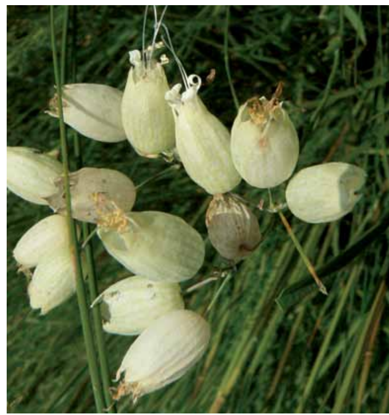
R5-4 | Hólyagos habszegfű