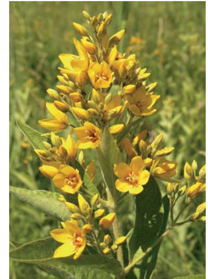
R5-4 | Molnár-rét, közönséges lizinka