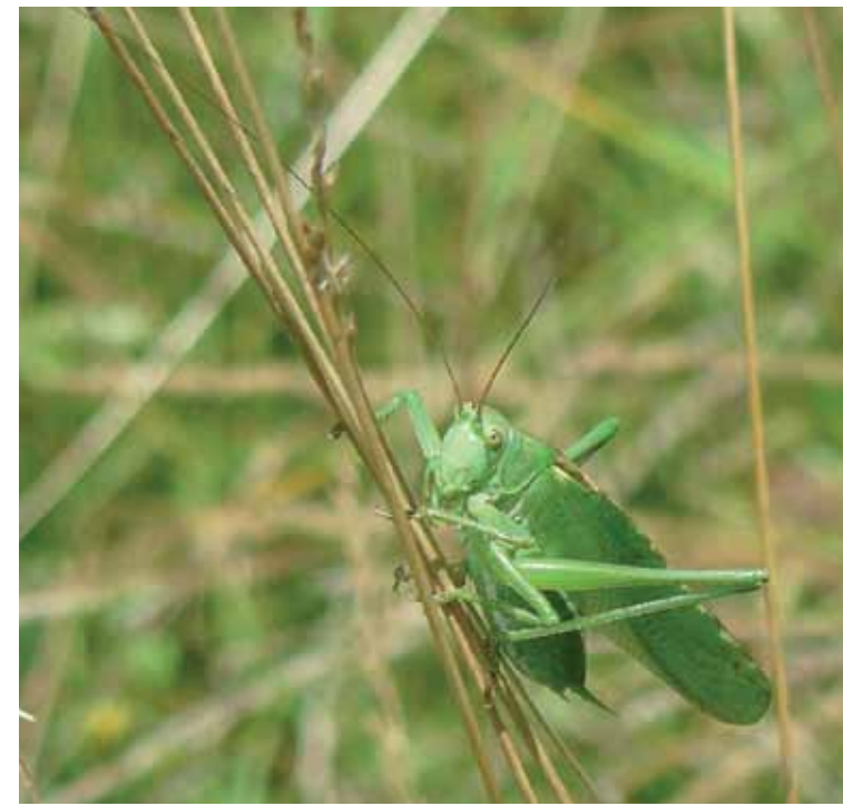
R5-4 | Zöld lomboszöcske