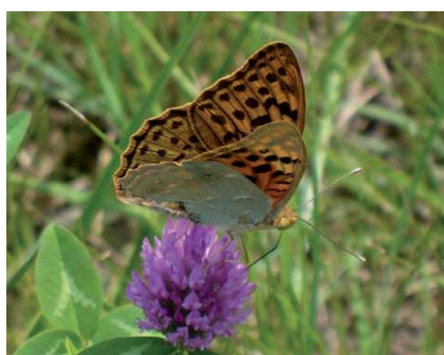
R5-4 | Nagy gyöngyház- lepke

„Röszke északnyugati részén húzódik a Homokhátság délkeleti pereme. Lapos, kiterjedt lepelhomok-hátait szélvájta északnyugat–délkelet irányú szélbarázdák tagolják, amelyeket a helyiek semlyékeknek hívnak. Kialakulásukban és fennmaradásukban jelentős szerepet kapnak a lokális, illetve a Homokhátság magasabb részei felől érkező regionális talajvízáramlások is. A csapadékhiány és a belvízelvezetés hatására bekövetkezett talajvízszint-süllyedés jelentősen veszélyezteti az élővilágukat. Röszke legszebb állapotú semlyékei a Molnár-rét, a Kókai-rét, a Kancsal-rét és a Madaras-rét. Az előbbi kettőn még vannak láprétek, míg az utóbbi kettőn szikes rétek dominálnak.” (Sára Endréné, 2011)