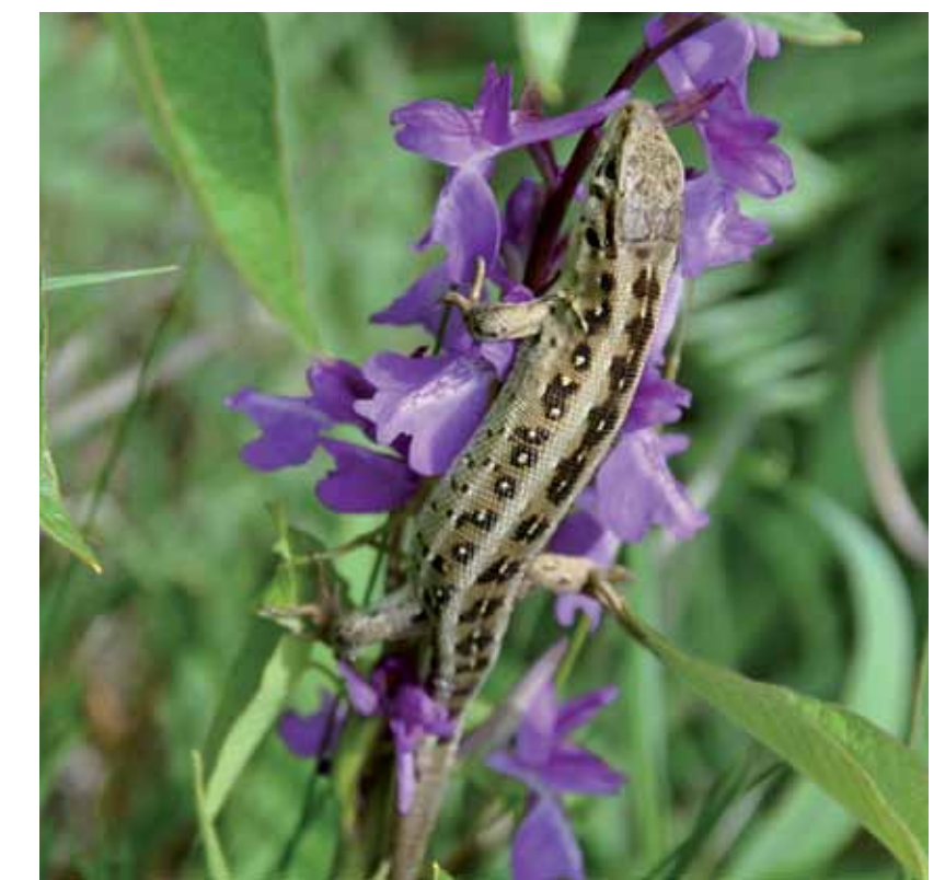
Fürge gyík mocsári kosboron