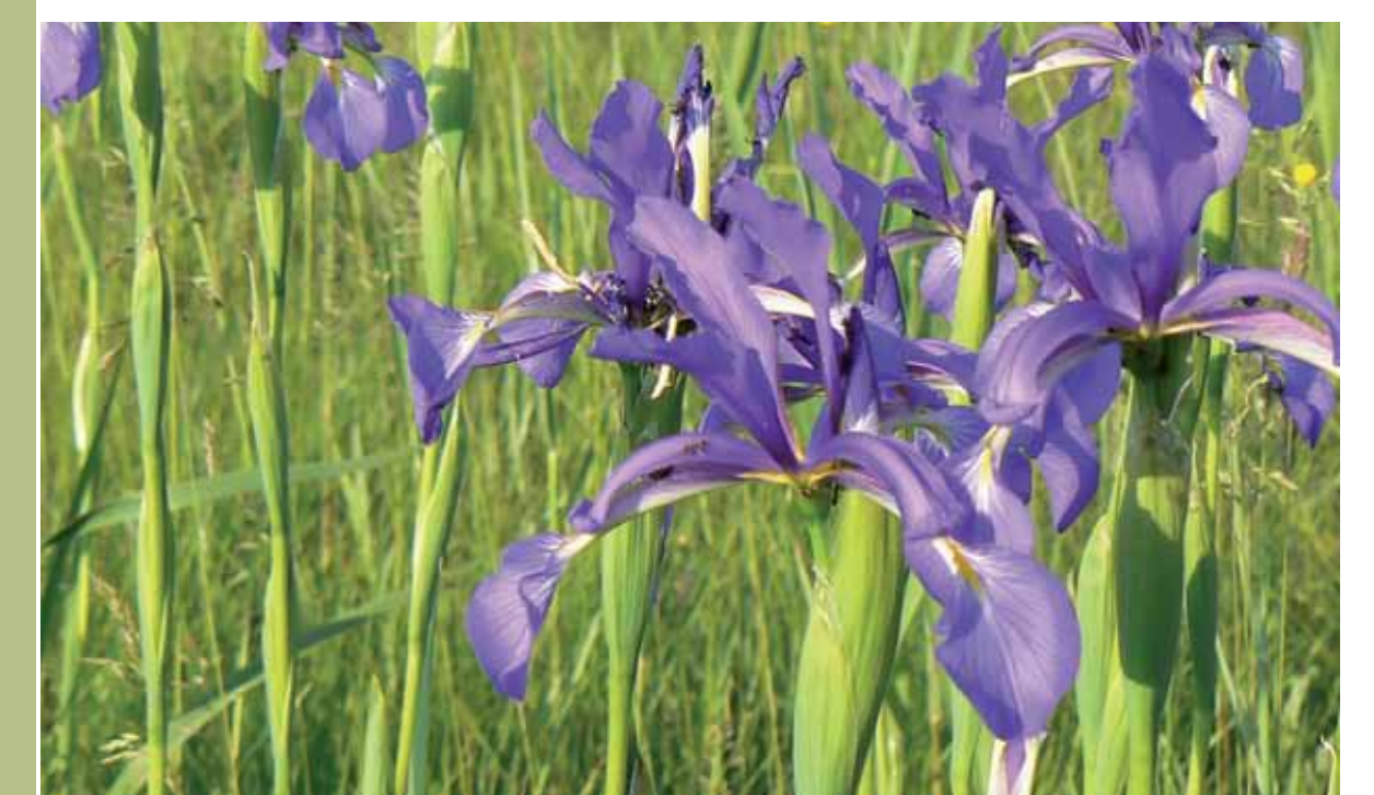
R5-8 | Börcsök-szék, fátyolos nőszirm