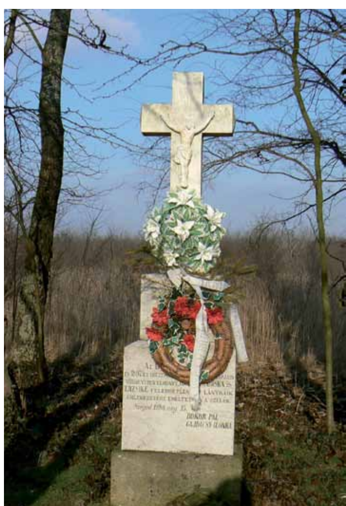
R1-27 | Bokor-kereszt