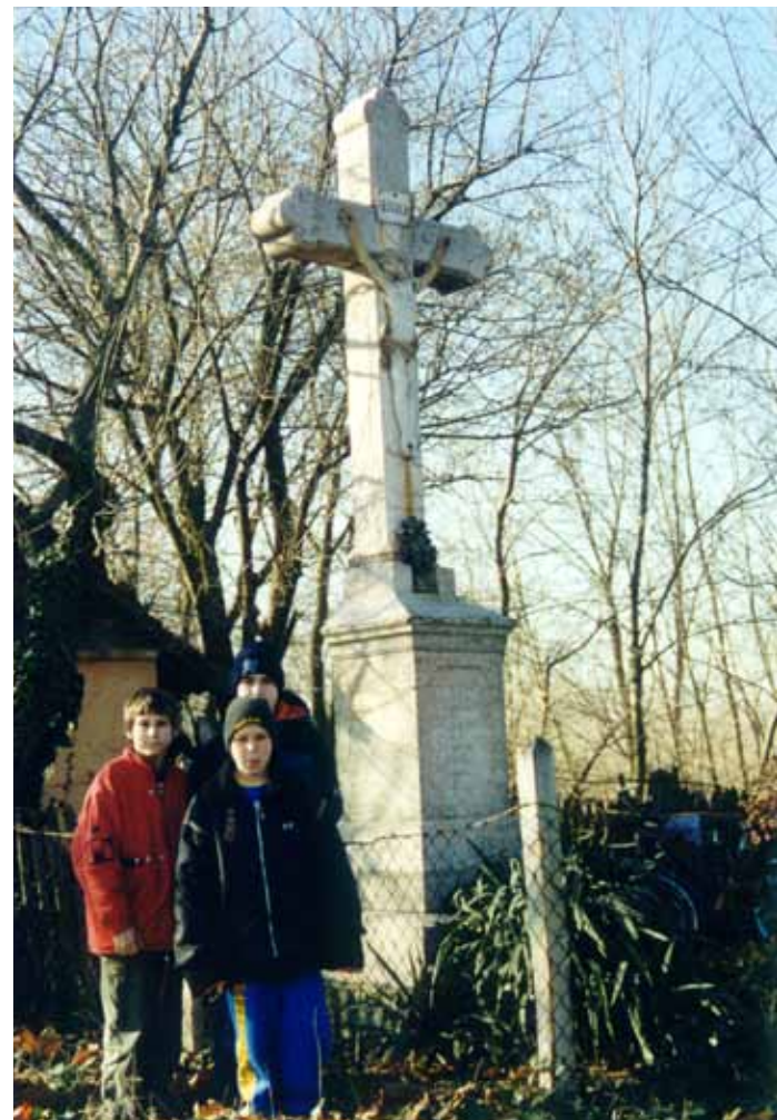
R1-28 | Börcsök-kereszt