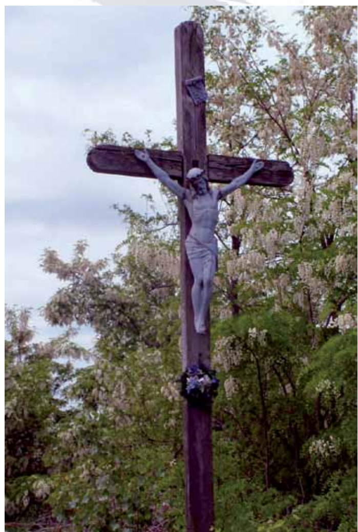
R1-36 | Szulcsán-kereszt