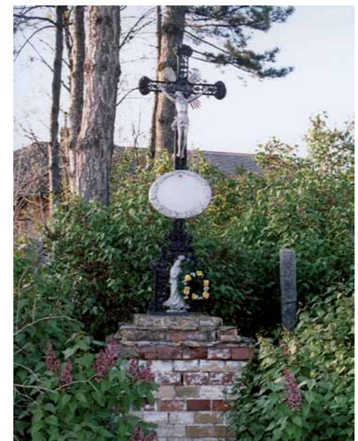
R1-35 | Kisszéksósi-kereszt

Különleges díszítésű az Alsó iskolai kereszt, sok falubeli számára kedves hely, hiszen mindig friss virág díszíti. A keresztben egy dombormű található, mely egy halat ábrázol, fölötte a görög alfa és alatta az omega betű. A hal Jézus jelképe, akinek követői Galileában halászattal és földműveléssel foglalkoztak. Jézus fogalmazta meg apostolainak, hogy legyetek az „emberek halásza”. (A felső képen: temetői harang, R1-232)