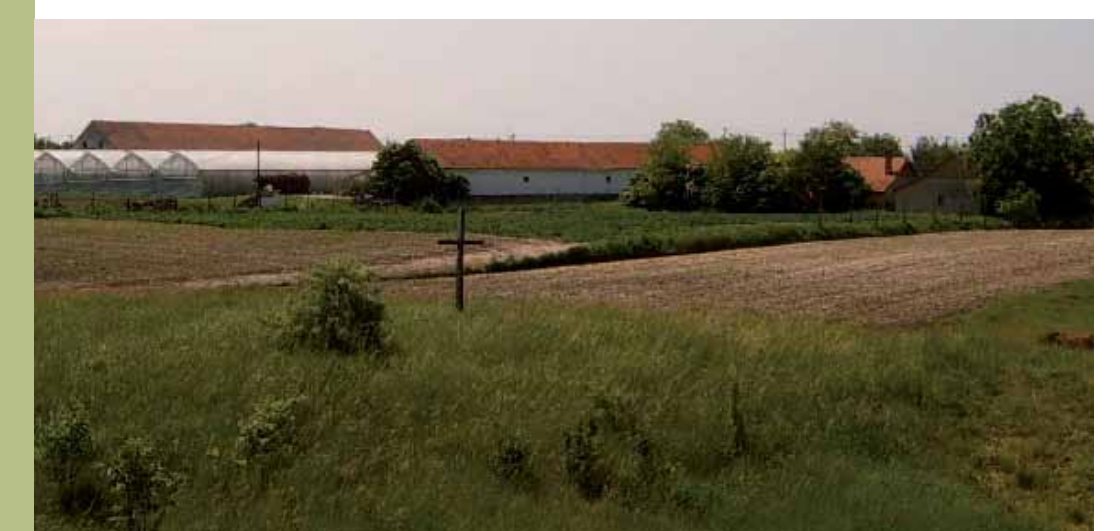
R1-21 | A Rác-domb a kereszttel (Rác-körösztt)