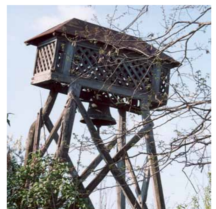
R1-24 | Harangláb a Kalmár-iskola mellett