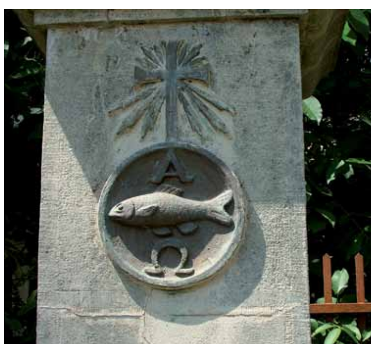
R1-26 | Útszéli kereszt a Felszabadulás utcában