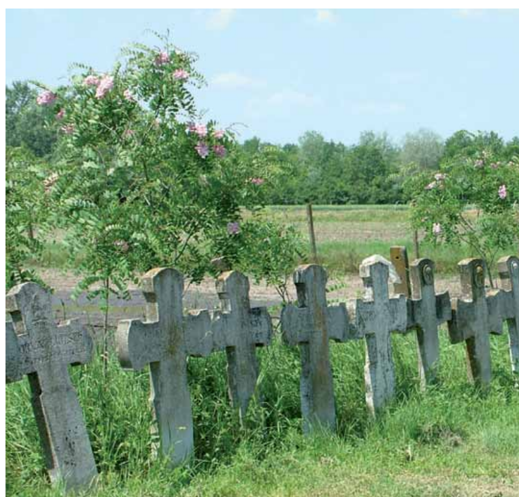
R1-22 | Óseink emléke a temetőben