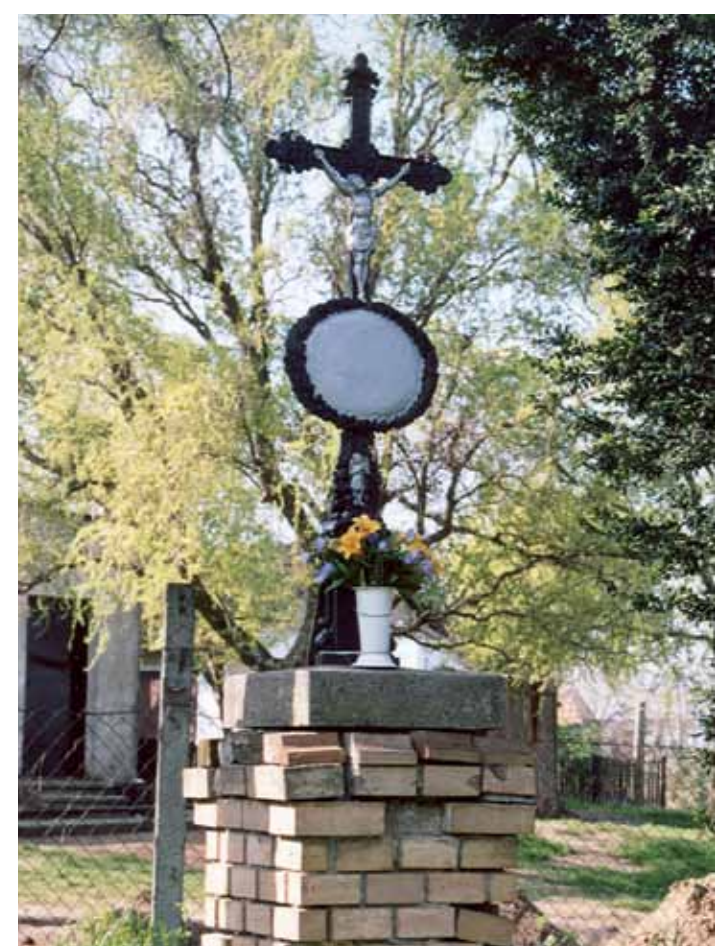
R1-33 | Kancsal-kereszt