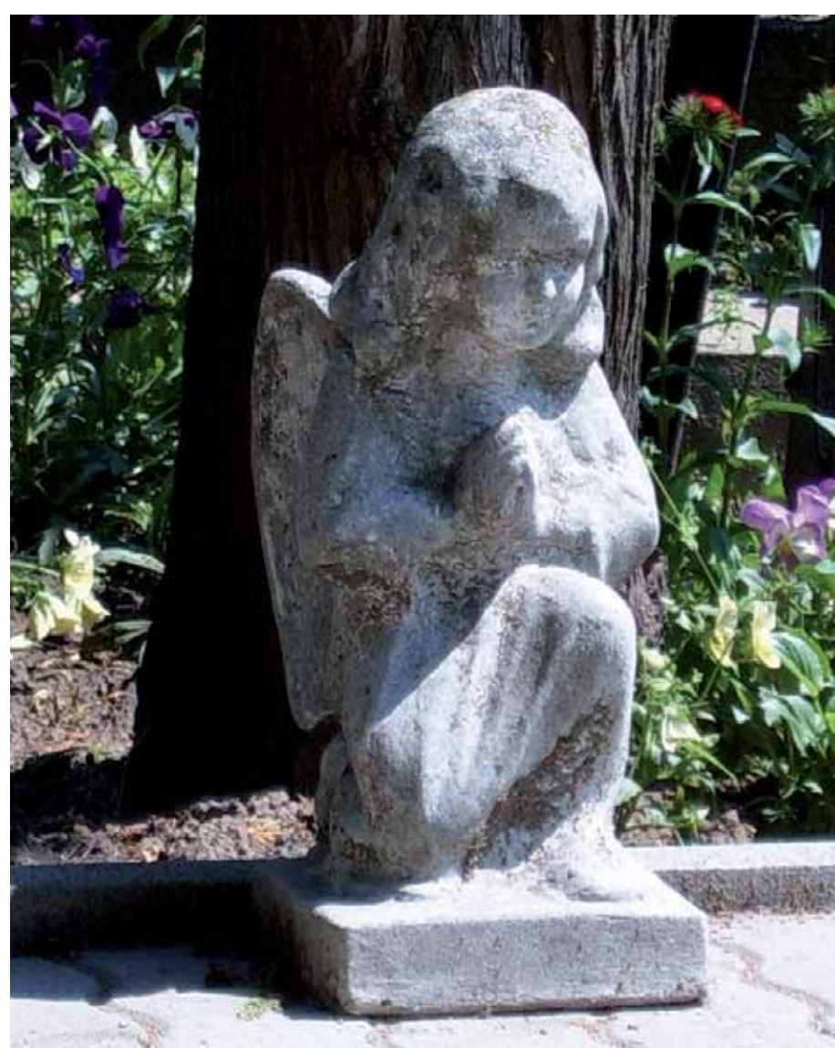
R1-23 | Angyal szobor a temetői haranglábon