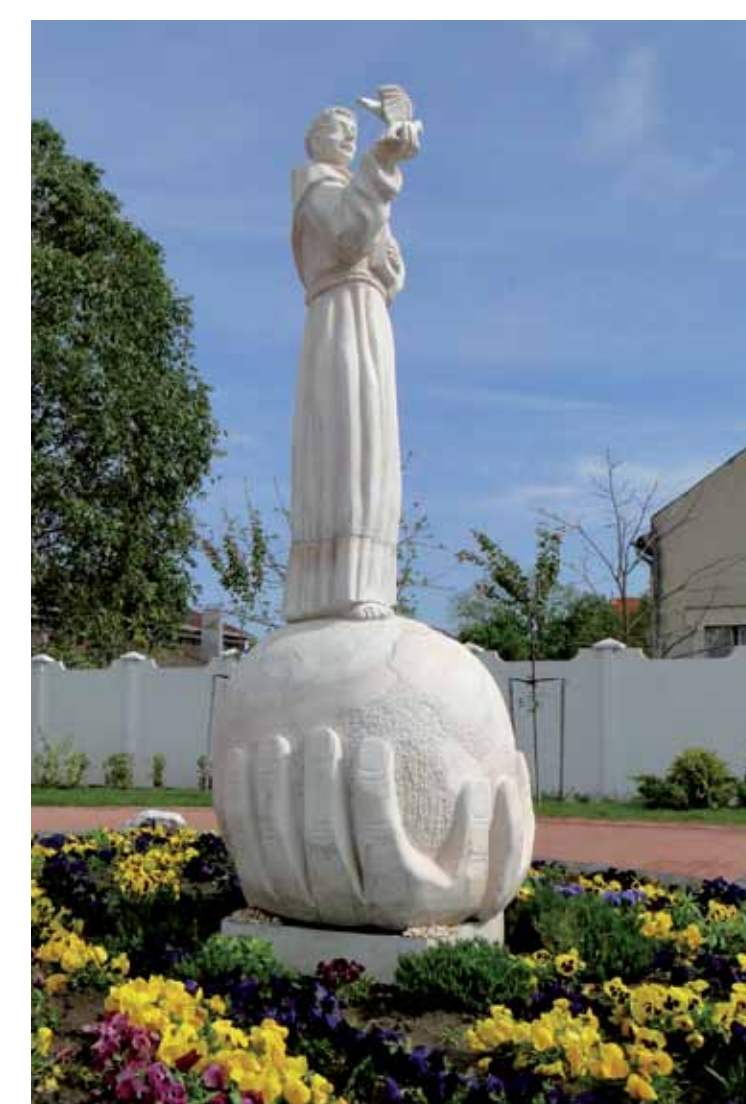
R1-41 | Szent Antal szobor