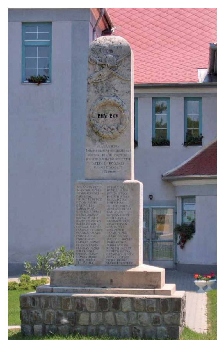
R4-1 | I. világháború emlékoszlopa