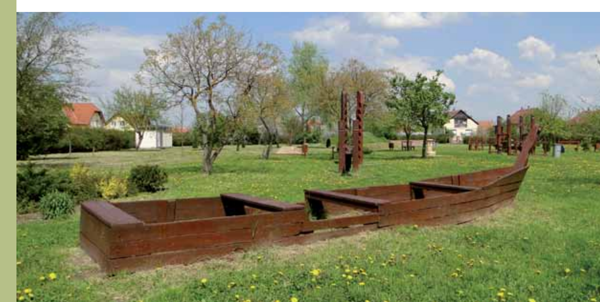
R1-17 | Falusi játszótér