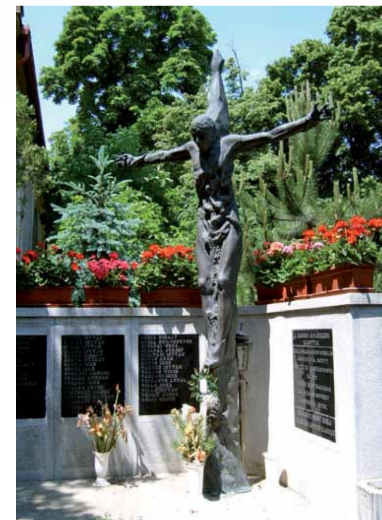
II. világháború emlékműve a templomkertben