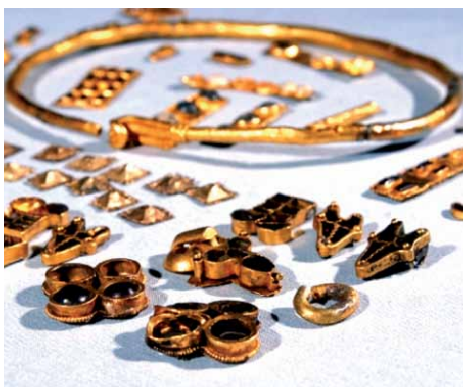
R4-6 | Nagyszéksósi aranyelet