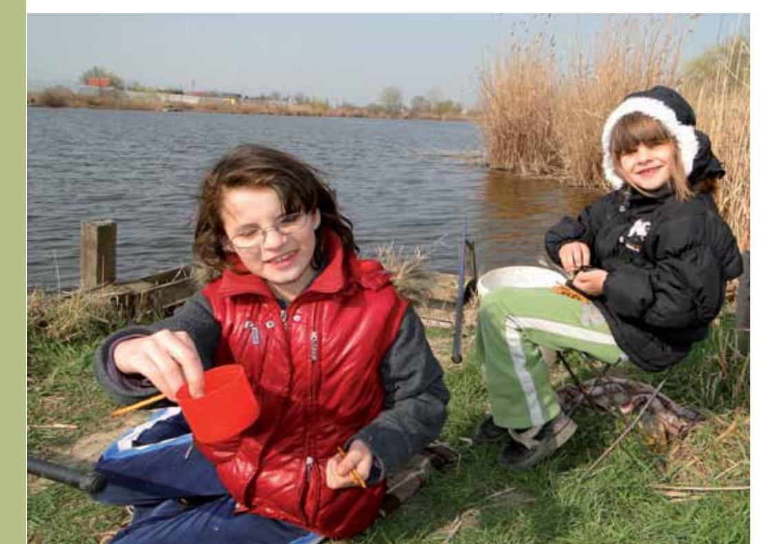
R5-18 | Gyerekek a Gyálai Holt-Tiszánál