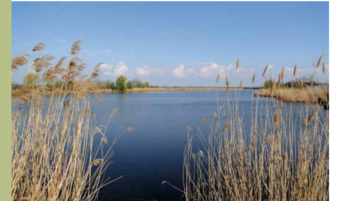
R5-18 | Gyálai Holt-Tisza kora tavasszal