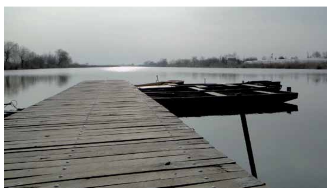
R5-18 | Holt-Tisza alkonyatban

„A Gyálai Holt-Tisza a Tisza szabályozása során a mentett oldalon jött létre 1885-ben. Hossza 18,7 km, átlagos szélessége 86 m, területe 160 ha, átlagos vízmélysége 1-3 méter, víztérfogata 4,8 km 3 , a legnagyobb tiszai holtág. A medrét áttöltésekkel és zsilipekkel 3 bögére osztották: az I. böge a Halászvíz (a Lúdvári-szivattyúteleptől a Szerűskerti-átjáróig), a II. böge Fehérpart (a Szerűskerti-átjárótól a Fehérparti-átjáróig), míg a III. böge a Feketevíz (a Fehérparti-átjárótól a Hattyasi-szivattyútelepig) nevet viseli. A Halászvíz további 3 egységre osztható: a legdélebbi Hordós nevű szakasz a Röszkei-átjáróig tart (ez a legjobb vízminőségű), az ezt követő Lisztes a Röszkei-átjáró és a Ceglédi-átjáró közt helyezkedik el, amelyet a Sárgás és Görbe szakaszok követnek.