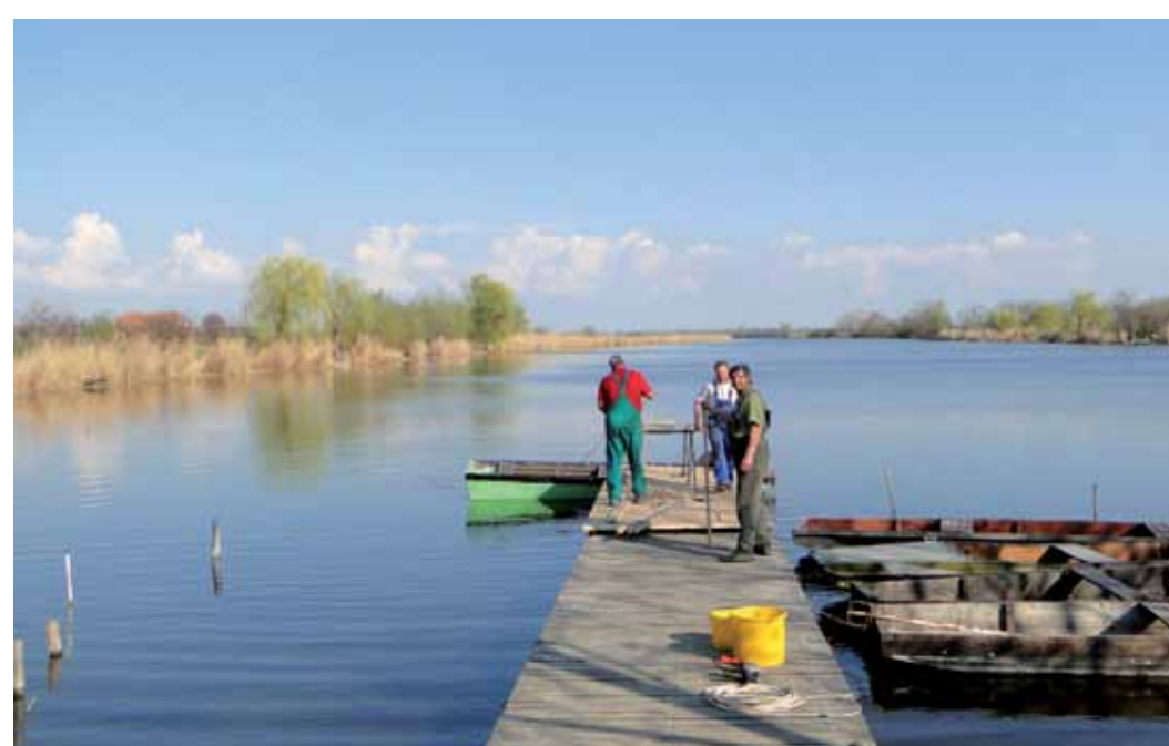
R5-18 | Gyálai Holt-Tisza