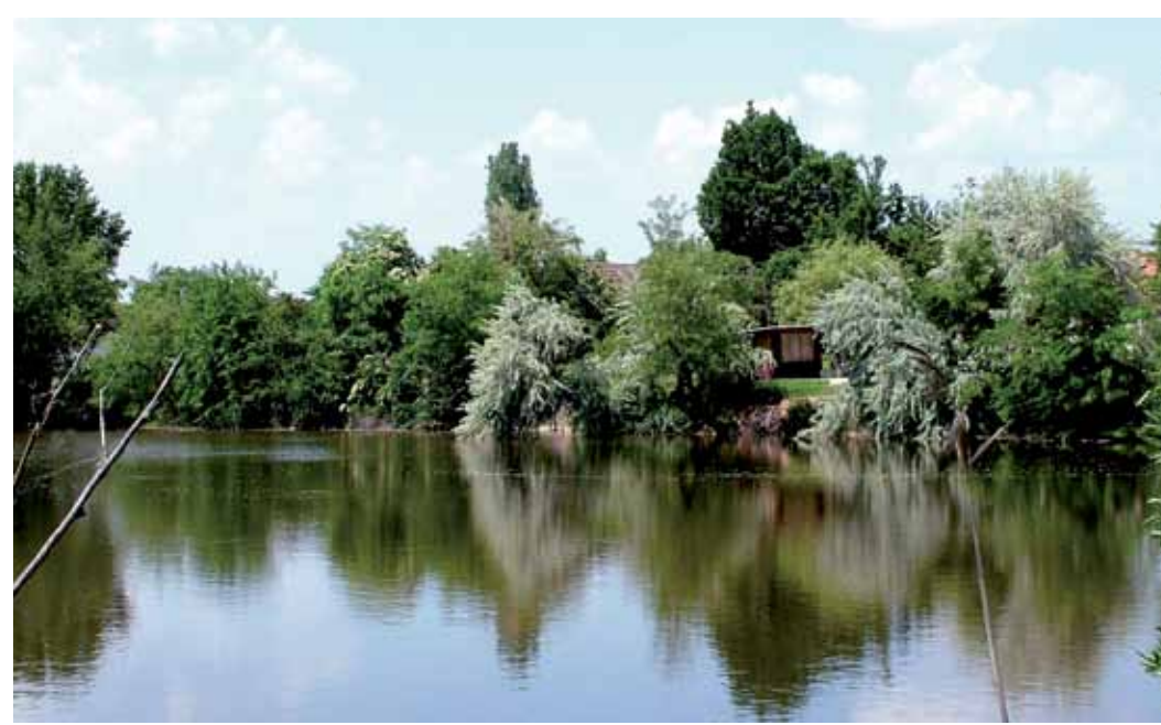
R5-18 | Gyálai Holt-Tisza-part a Hordós bögénél