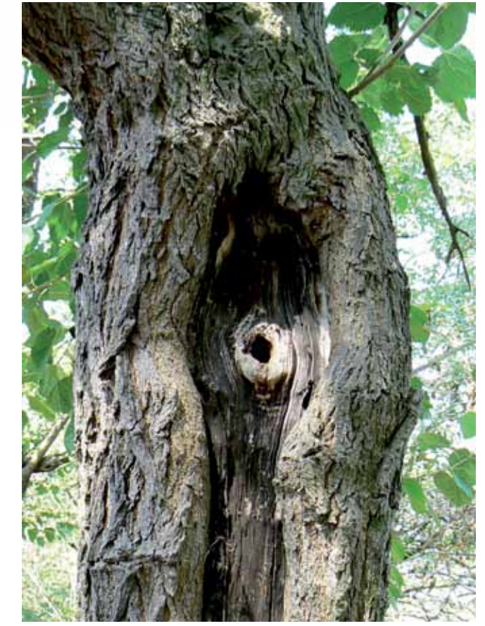
R5-18 | Óreg eperfa a Gyálai Holt-Tisza partjánál

A holtág minden évszakban és napszakban rejteget valami meglepőt, valami soha vissza nem térő pillanatot. A Lisztes átjárónál információs pont áll rendelkezésre padokkal, valamint egy csónakkikötő. Látogasson el ide, üljön le, nyissa ki szemét, fülét és leginkább a szívét! Keresse a szépet, a maradandót, az értékeket!