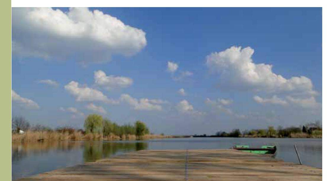
R5-18 | Gyálai Holt-Tisza a Lisztes átjárónál