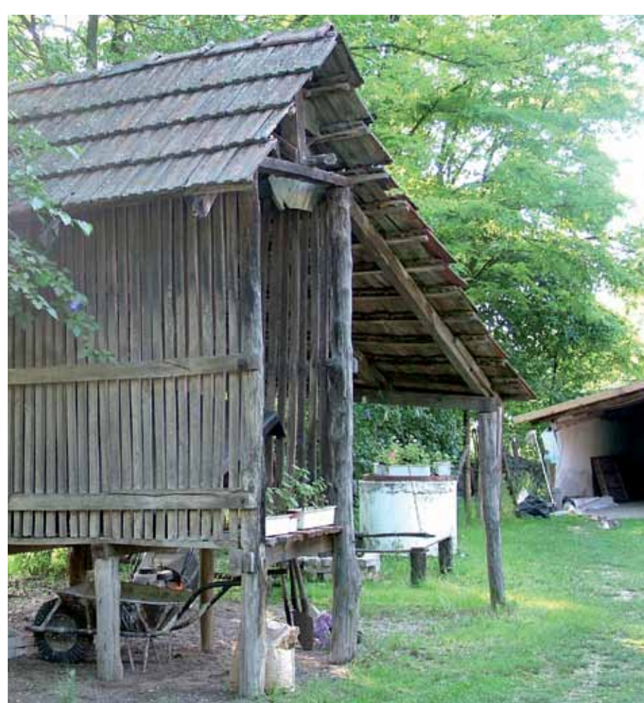
R1-50 | Kukoricagóré a Kisszéksői úton