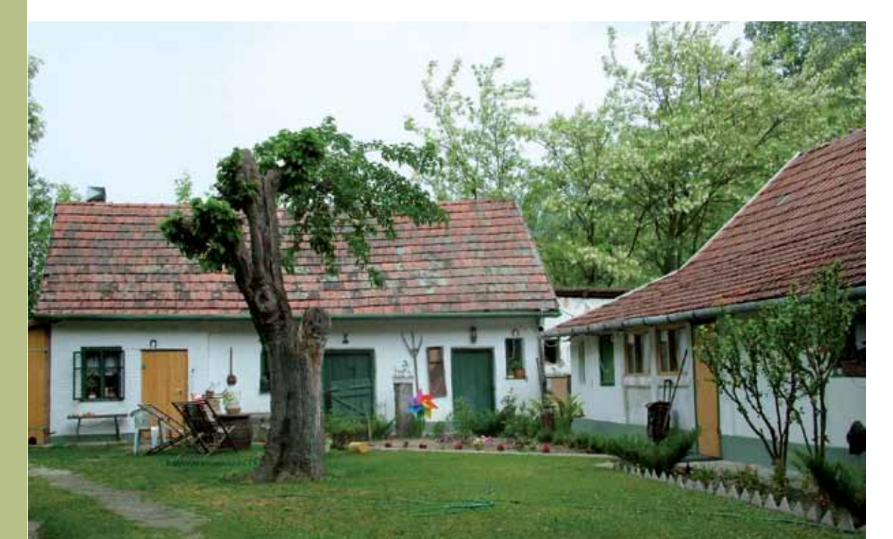
R1-50 | Papdi ház belső udvara