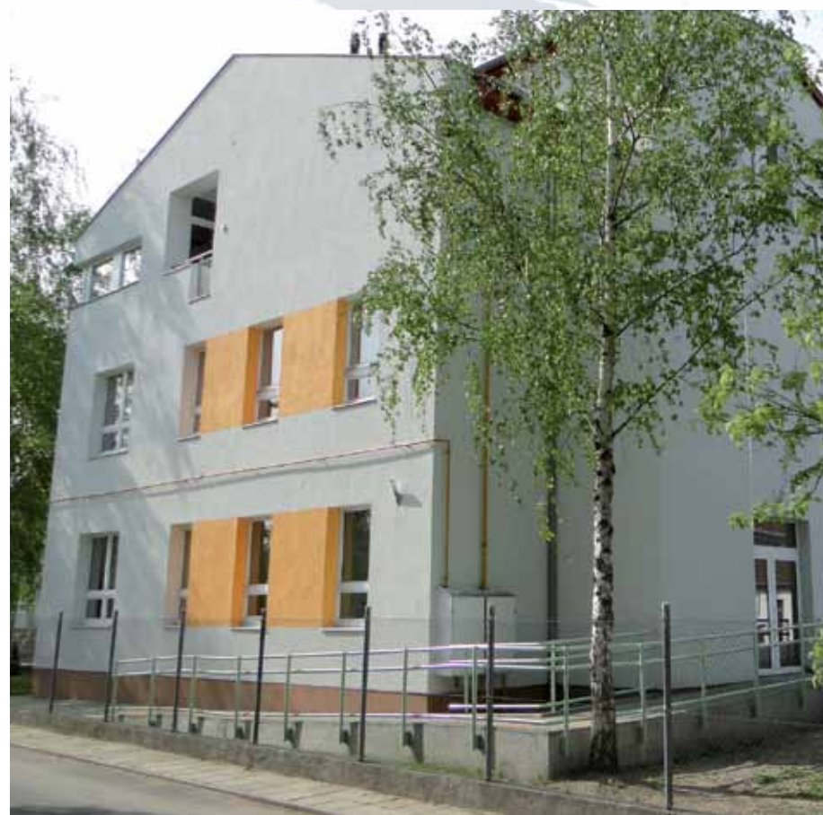
R1-08 | Orbán Dénes Általános Iskola