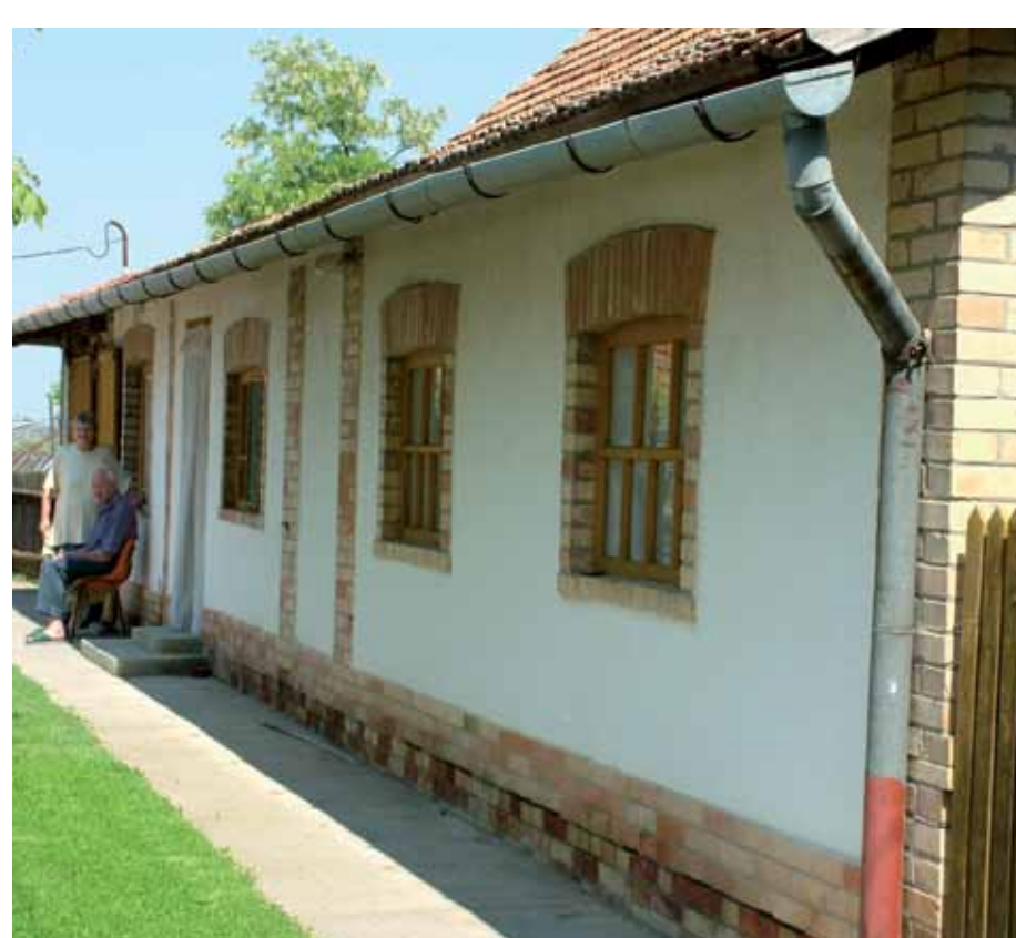
R1-02 | Jellegzetes kővel díszített ház Felszabadulás u. 27.