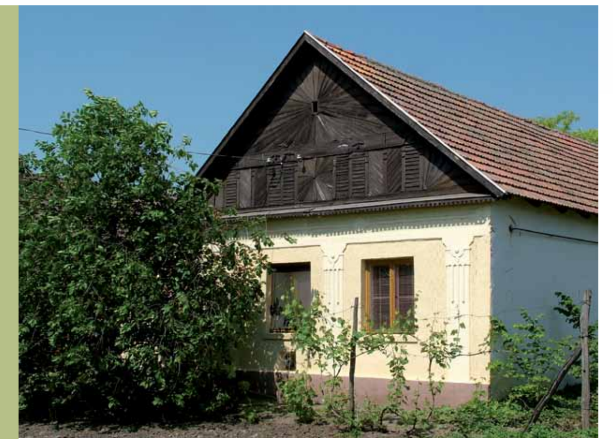
R1-06 | Napsugaras oromzatú ház

A település óvodája eredetileg gazdasági funkciót ellátó épület volt, majd óvodává alakították, melyet 1998-ban felújítottak. Jelenleg bölcsőde is működik az épületben. A Község-háza egykor gyógyszer-tár volt, jelentős építészeti értéket képvisel. A település kulturális életének és mindennapjainak fontos részét képezte és képezi ma is, 2007-ben újították fel. Az épület kéményére több mint 10 éve az iskola környezetvédelmi szakkörének kezdeményezésére a polgármester segítségével a fehér golyák részére fészekaljzat készült. Azóta minden évben vannak lakói.