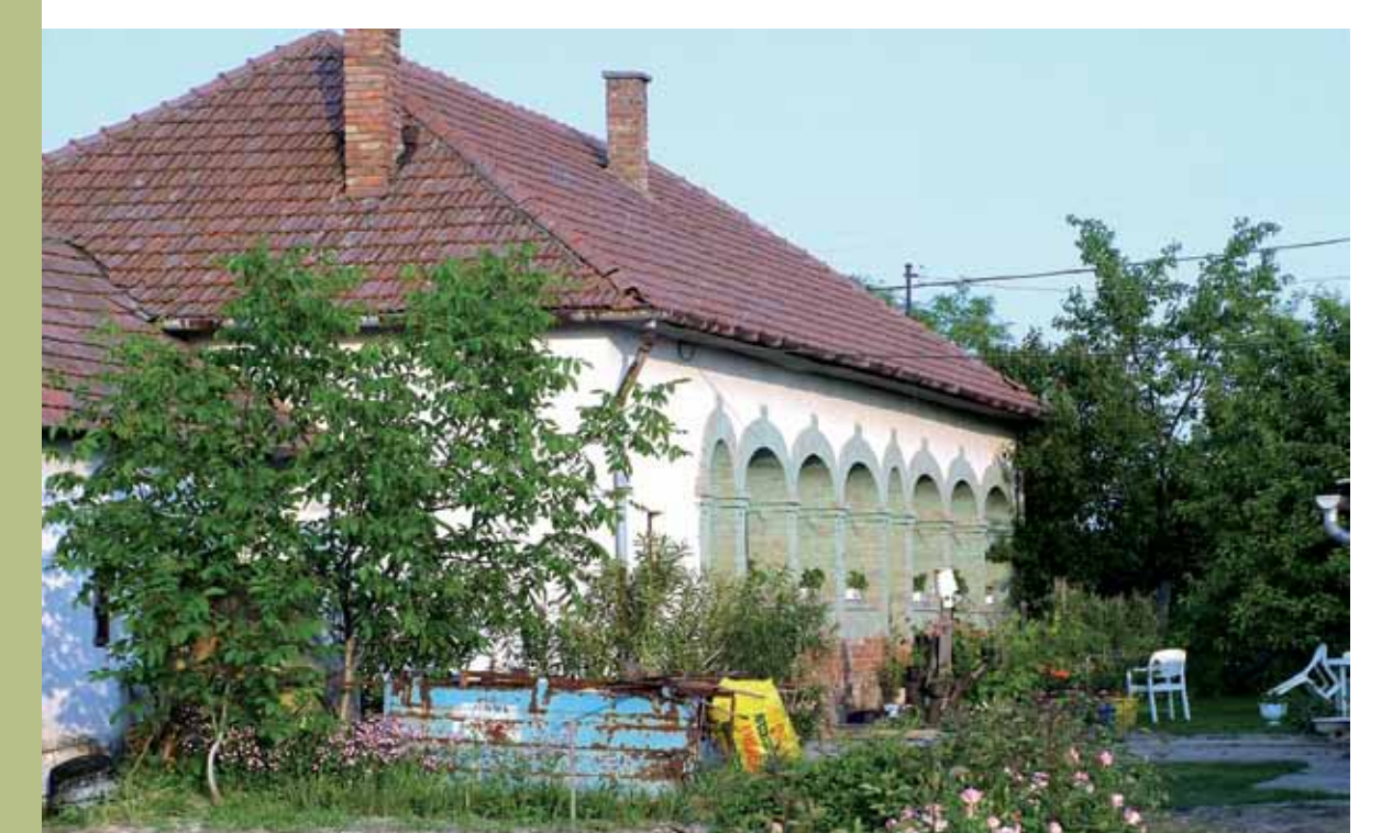
R1-01 | Boltíves falusi ház