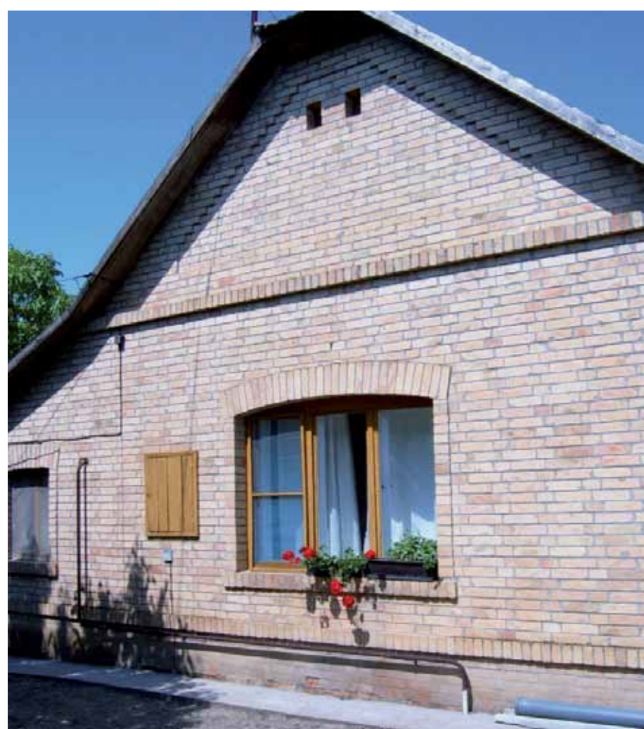
R1-03 | Kőoromzatú ház