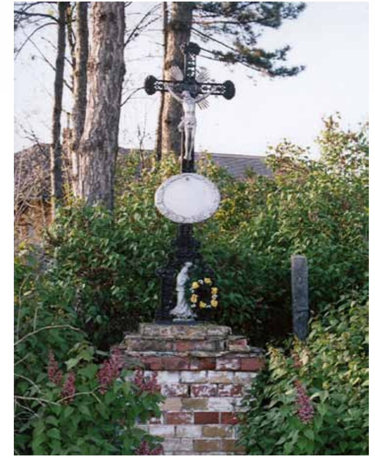
R1-35 | Kisszéksósi-kereszt

Különleges díszítésű az Alsó iskolai kereszt, sok falubeli számára kedves hely, hiszen mindig friss virág díszíti. A keresztten egy dombormű található, mely egy halat ábrázol, fölötte a görög alfa és alatta az omega betű. A hal Jézus jelképe, akinek követői Galileában halászzattal és földműveléssel foglalkoztak. Jézus fogalmazta meg apostolainak, hogy legyetek az „emberek halászhai”. (A felső képen: temetői harang, R1-232)