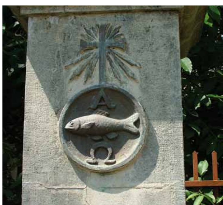
R1-26 | Útszéli kereszt a Felszabadulás utcában