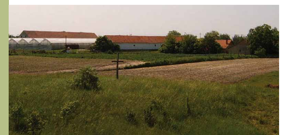
R1-21 | A Rác-domb a kereszttel (Rác-körösz)