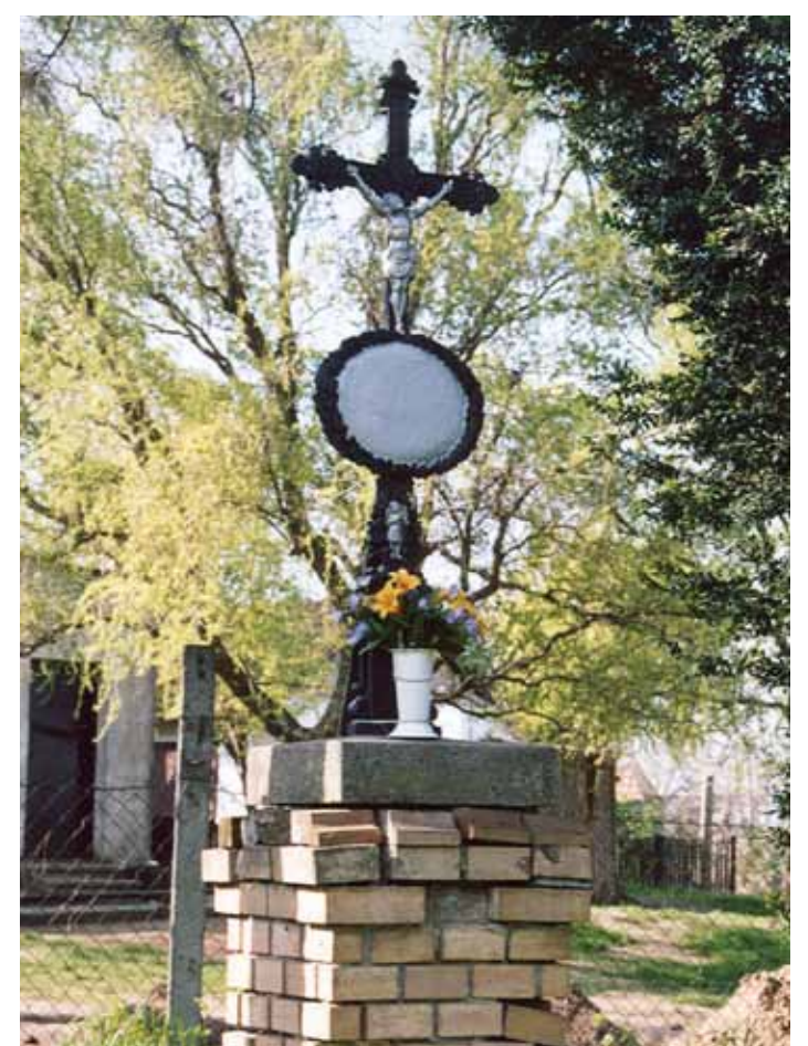
R1-33 | Kancsal-kereszt