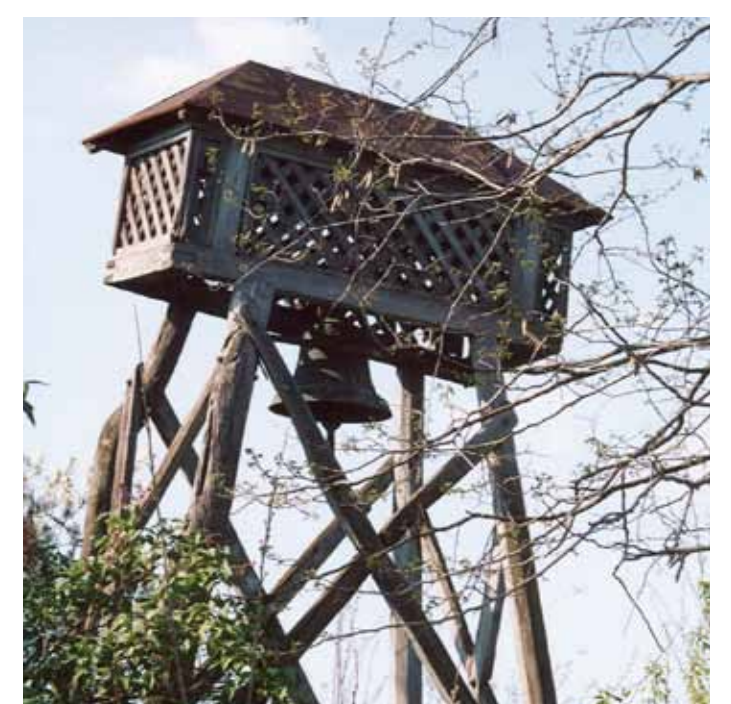
R1-24 | Harangláb a Kalmáriskola mellett