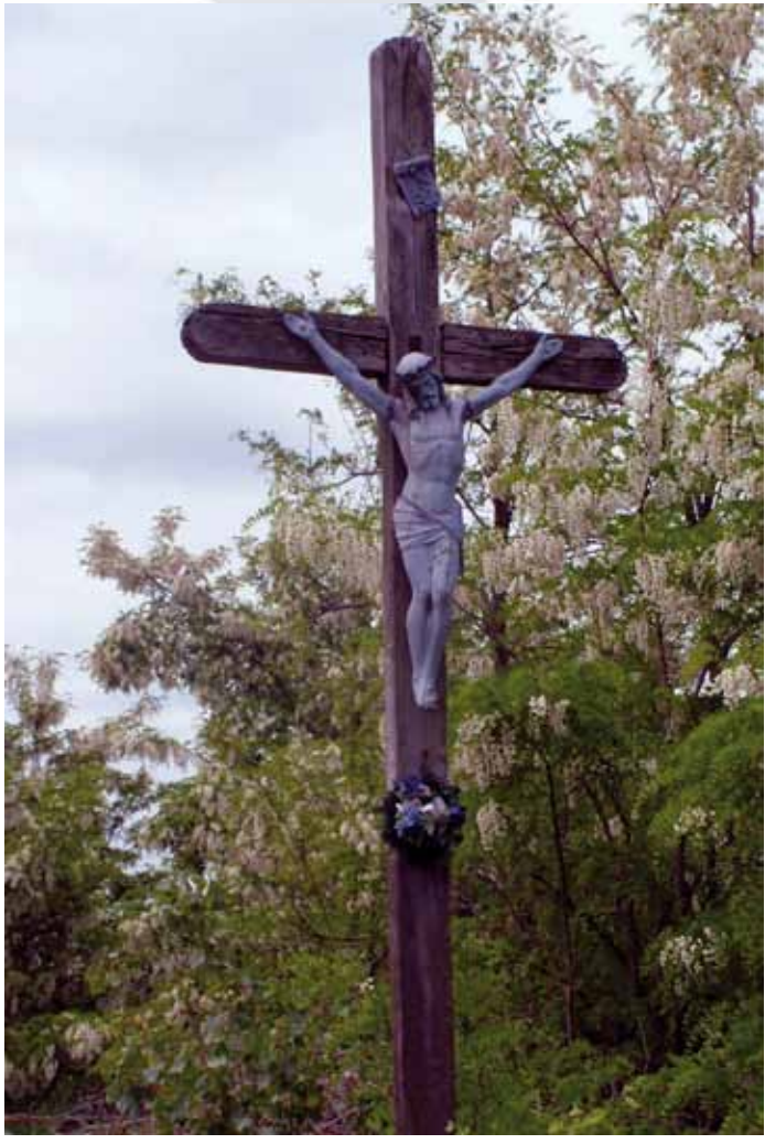
R1-36 | Szulcsán-kereszt