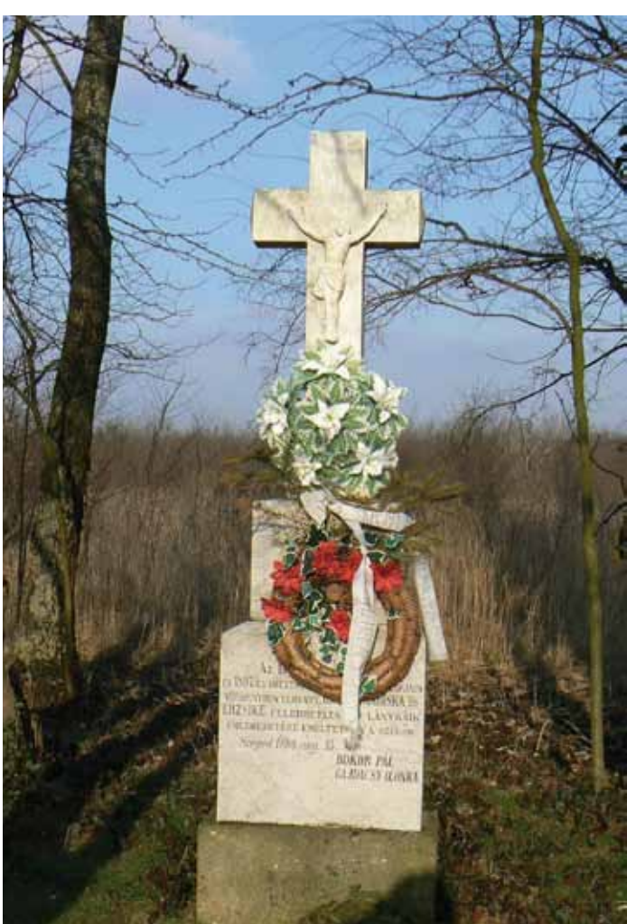
R1-27 | Bokor-kereszt