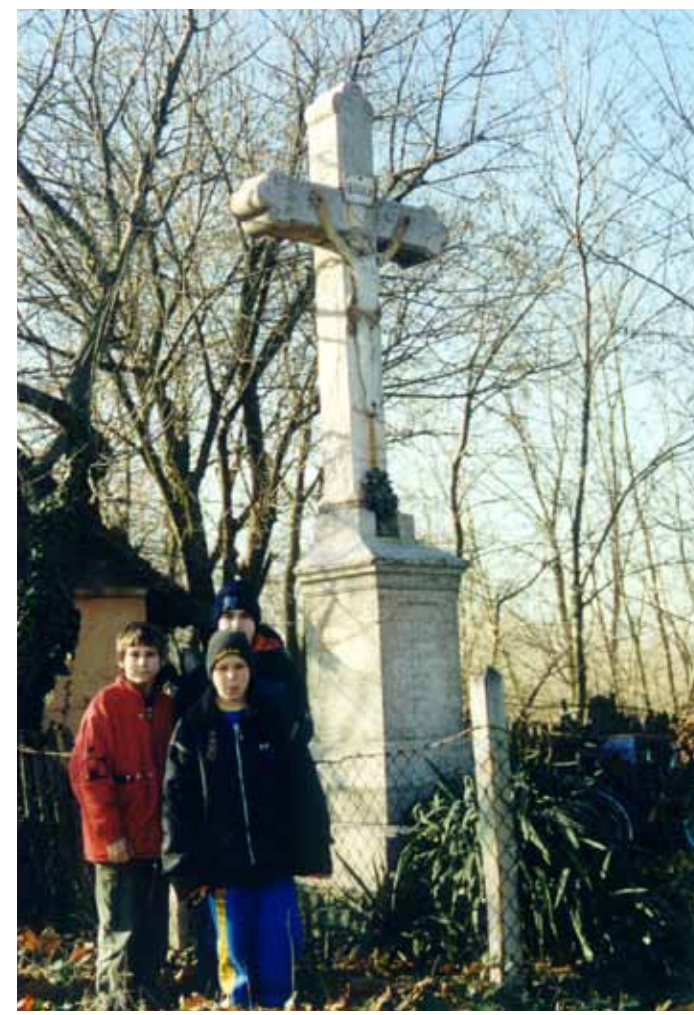
R1-28 | Börcsök-kereszt