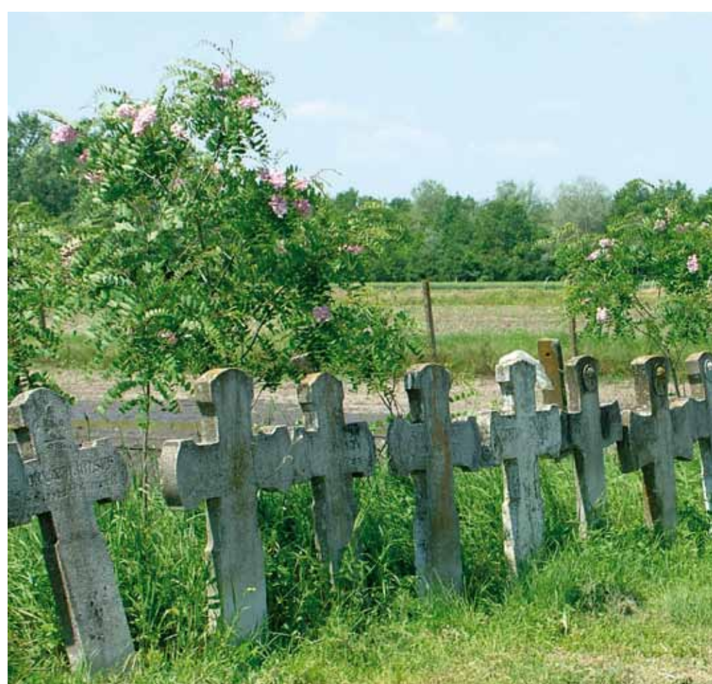
R1-22 | Óseink emléke a temetőben