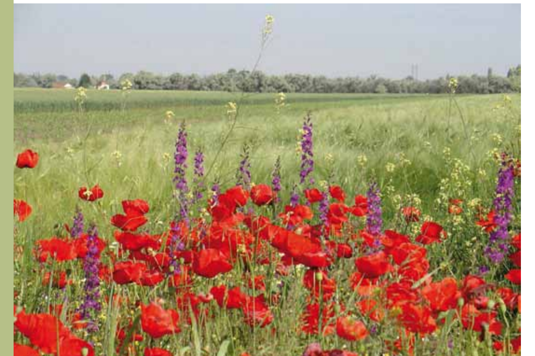
Pipacsok a határban