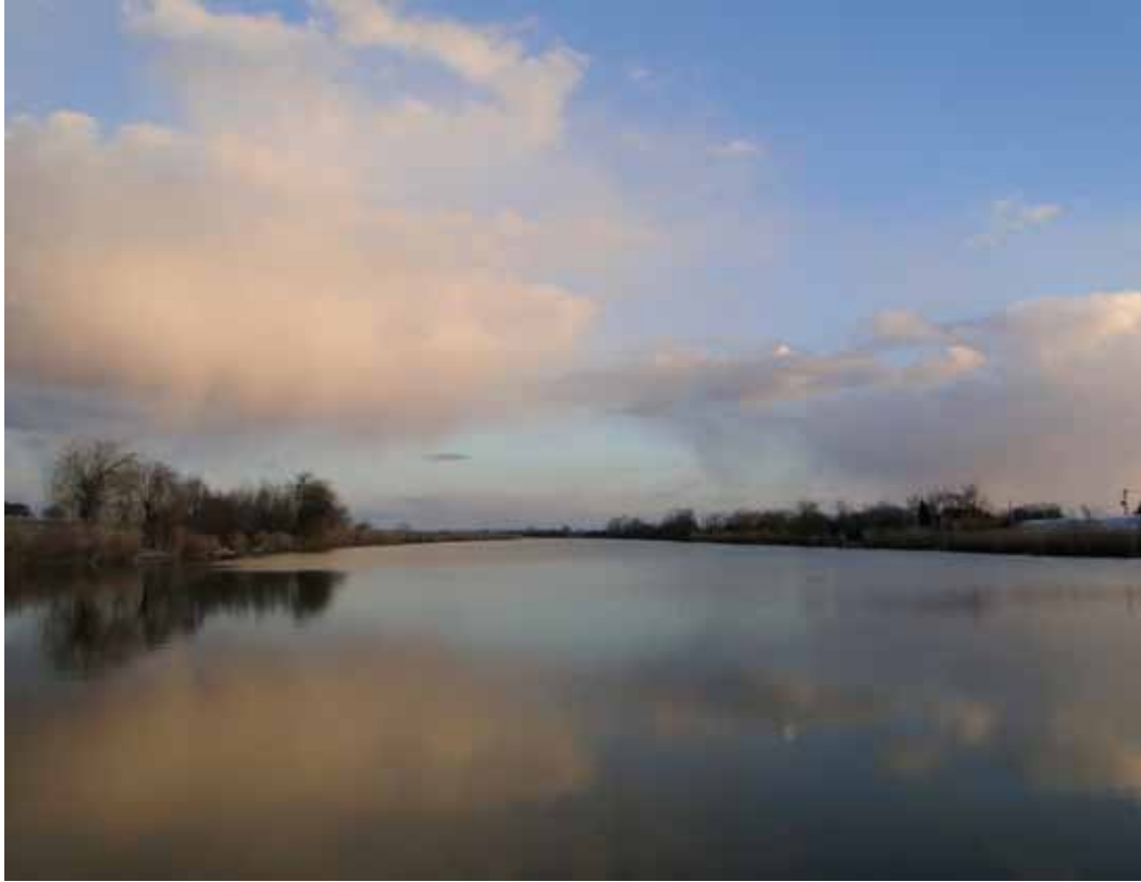
R5-18 | Gyálai Holt-Tisza varázsa