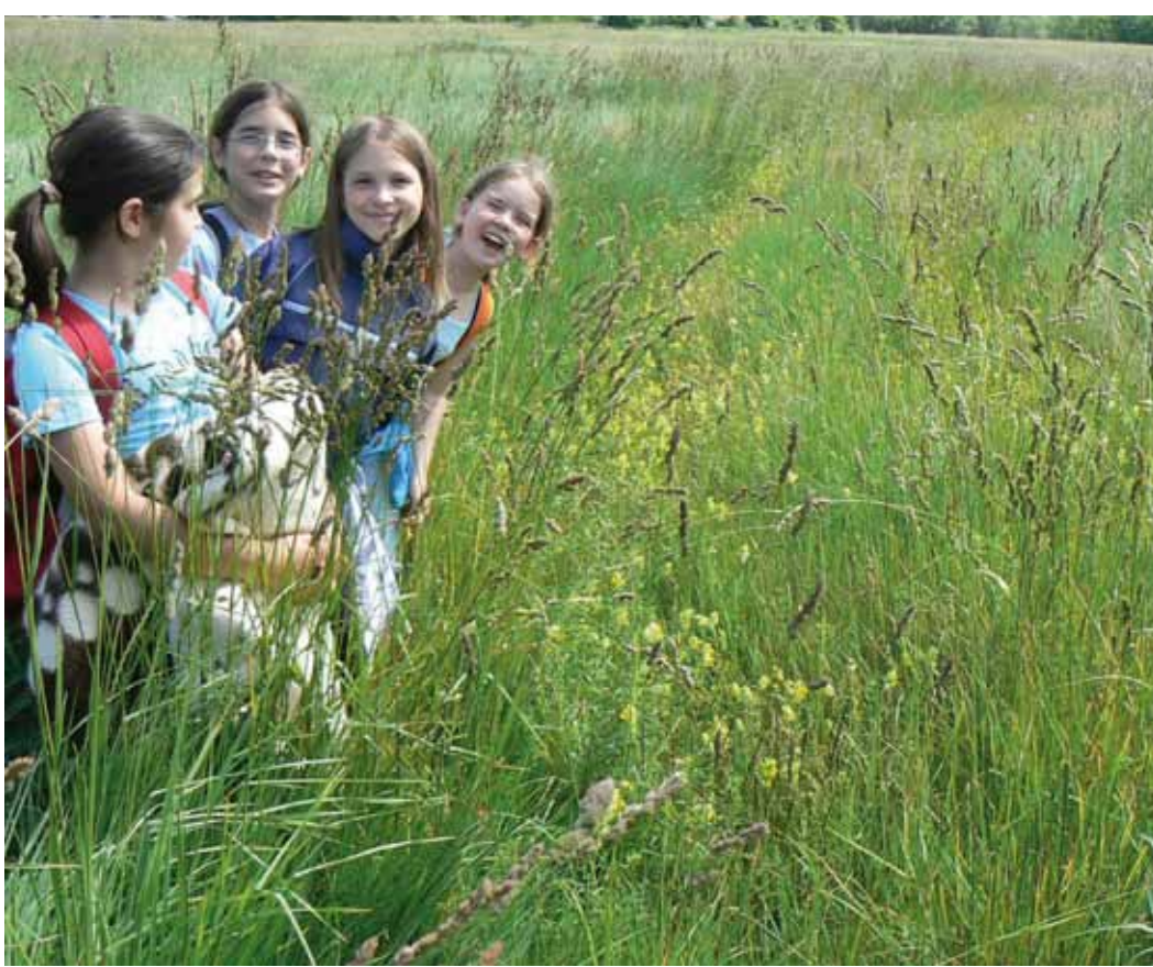
R5-4 | Lányok a Molnár-rét kakascímeres útján