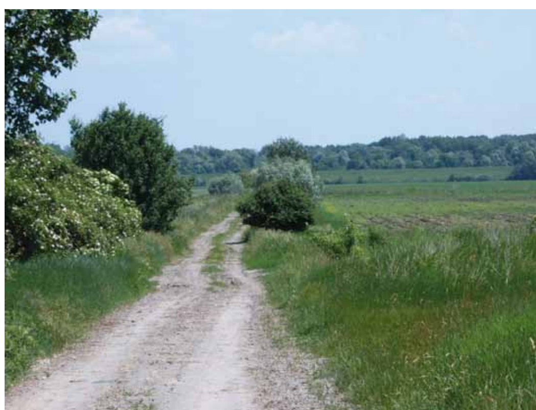
R5-4 | Út az élő Tiszához

Röszke három kistáj (a Dorozsma–Majsai-homokhát, a Szegedi-sík és a Dél-Tisza-völgy) határán található, többek között ennek köszönheti sokszínűségét. A település kialakulását és fejlődését alapjaiban meghatározta a Tisza közelsége, hiszen a folyó halban és vadban gazdag mocsarai, az árvizek által időnként elöntött területek kedvező gazdálkodási feltételeket teremtettek az itt élők számára. A folyószabályozás nyomán még inkább bővült a szántó művelésre alkalmas területek nagysága. A lösszel borított Szegedi-sík jó termőföldet szolgáltat a lakosság számára, a történelem során is ezt a tájat szántották be először. A település belterületétől északnyugati irányban a felszínt a futóhomok borítja, amelybe az uralkodó északnyugati szelek sekély mélyedéseket vájtak.