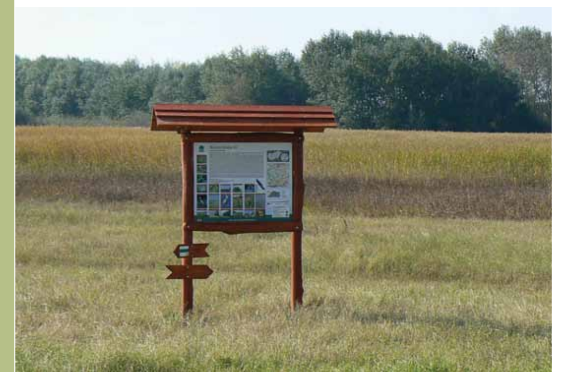
R5-3 | Kiszéksós-tó információs tábla