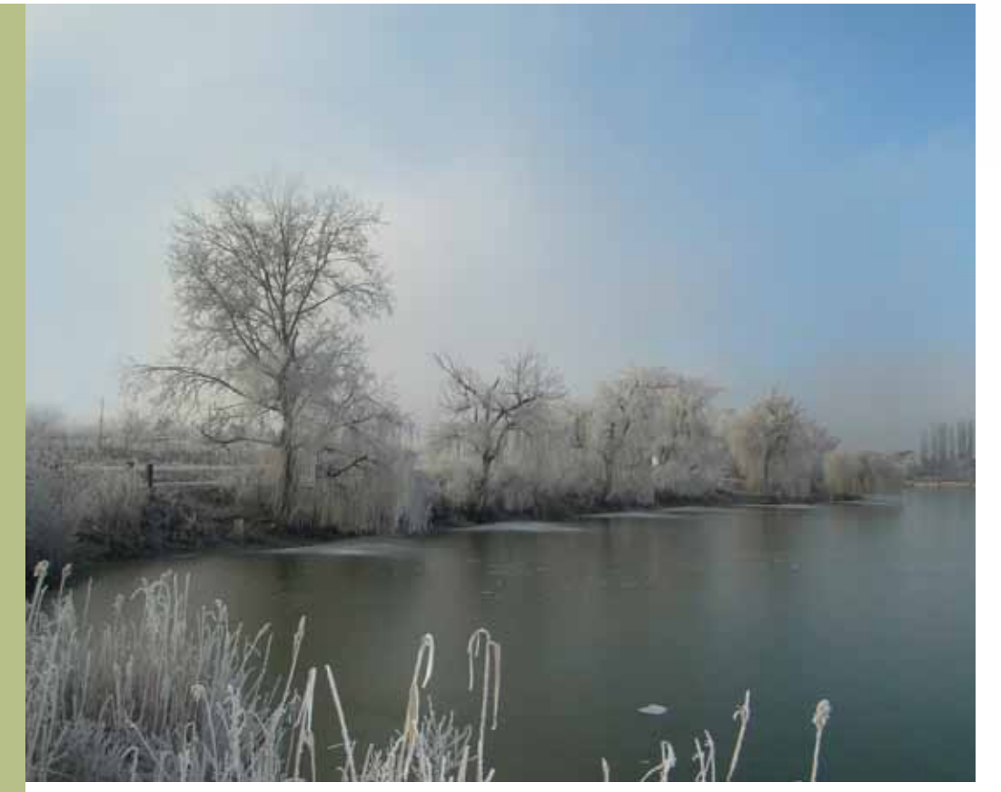
R5-18 | Gyálai Holt-Tisza