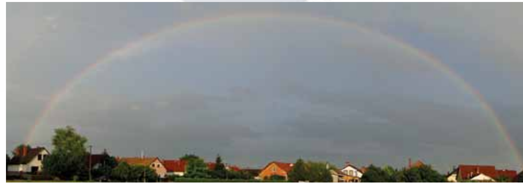
Szivárvány Röszke felett