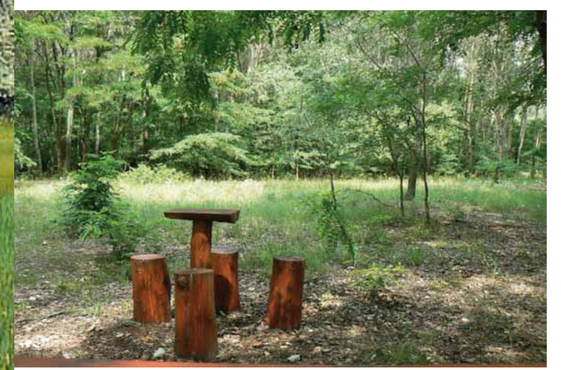
R5-4 | Erdei pihenő