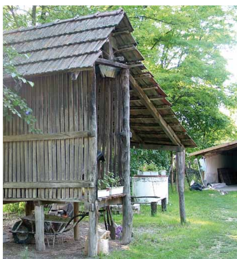
R1-50 | Kukoricagóré a Kisszéksői úton