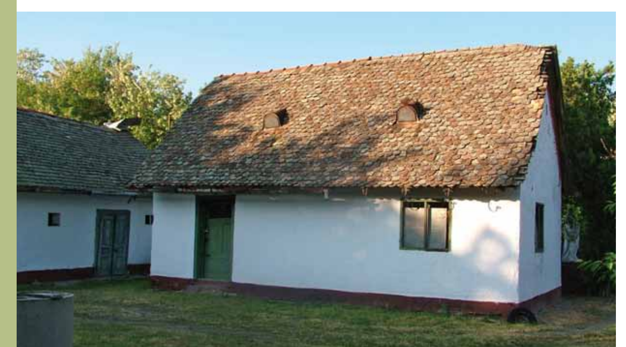
R1-49 | Börcsök kúria cselédháza