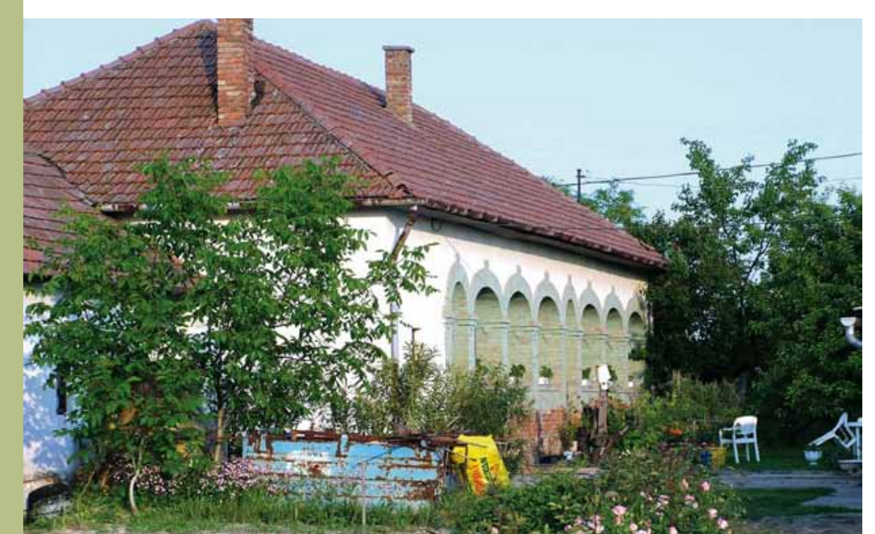
R1-01 | Boltíves falusi ház