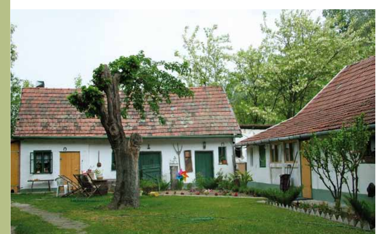
R1-50 | Papdi ház belső udvara