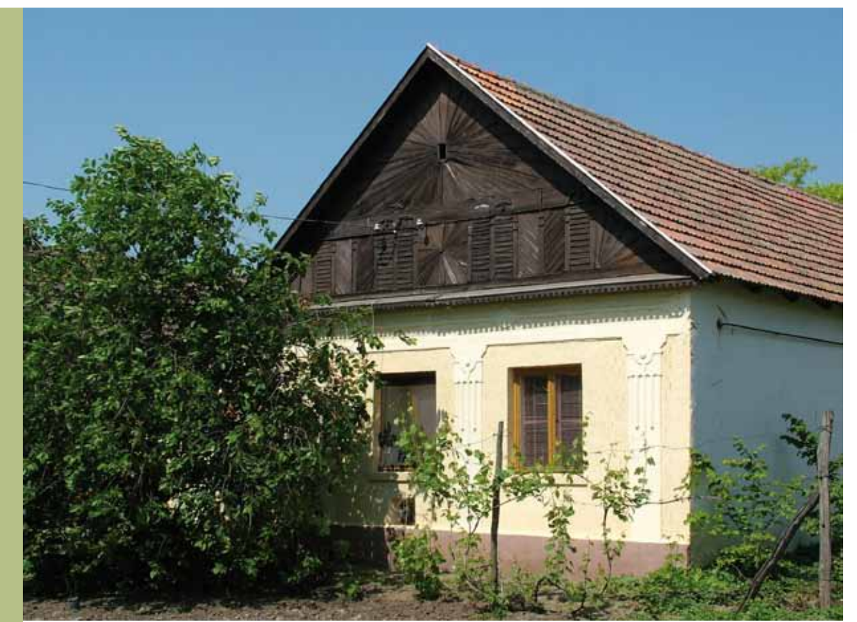
R1-06 | Napsugaras oromzatú ház

A település óvodája eredetileg gazdasági funkciót ellátó épület volt, majd óvodává alakították, melyet 1998-ban felújítottak. Jelenleg bölcsőde is működik az épületben. A Községkönyv egykor gyógyszerár volt, jelentős építészeti értéket képvisel. A település kulturális életének és mindennapjainak fontos részét képezte és képezi ma is, 2007-ben újították fel. Az épület kéményére több mint 10 éve az iskola környezetvédelmi szakkörének kezdeményezésére a polgármester segítségével a fehér golyák részére fészekaljzat készült. Azóta minden évben vannak lakói.